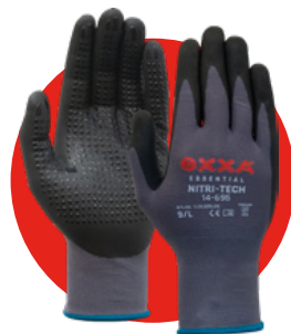
NITRI-TECH 14-695 Art.nr. 1.14.692.00