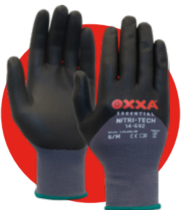
NITRI-TECH 14-692 Art.nr. 1.14.692.00